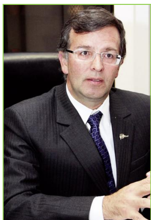
José Luis Silva Ministro de Comercio Exterior