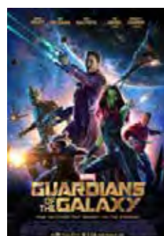
Guardianes De La Galaxia (Guardians Of The Galaxy) [2014] Dir: James Gunn