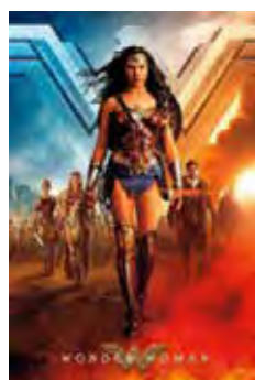
Mujer Maravilla (Wonder Woman) [2017] Dir: Patty Jenkins