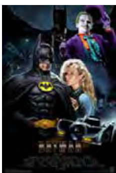
Batman (Batman) [1989] Dir: Tim Burton