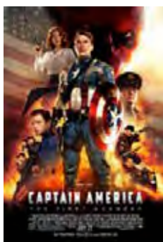
Capitán América: El Primer Vengador (Captain America: The First Avenger) [2011] Dir: Joe Johnston