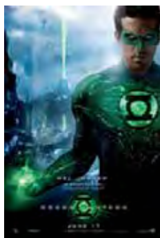
Linterna Verde (Green Lantern) [2011] Dir: Martin Campbell