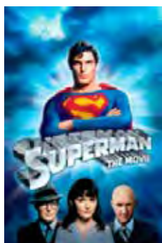
Superman (Superman) [1978] Dir: Richard Donner