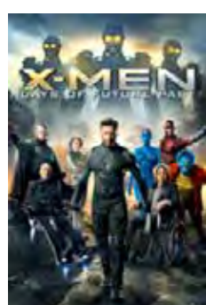
X-Men: Días Del Futuro Pasado (X-Men: Days Of Future Past) [2014] Dir: Bryan Singer