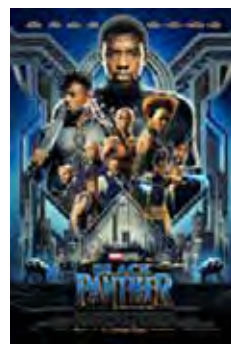
Pantera Negra (Black Panther) [2018] Dir: Ryan Coogler