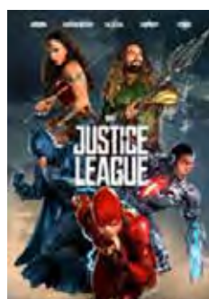
X-Men: Días Del Futuro Pasado (X-Men: Days Of Future Past) [2014] Dir: Bryan Singer