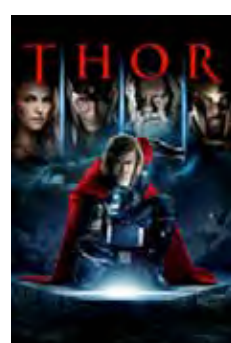
Thor (Thor) [2011] Dir: Kenneth Branagh