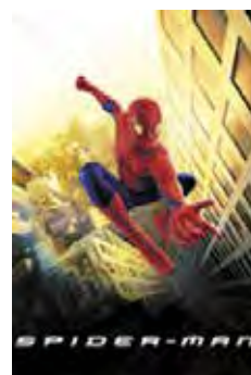
El Hombre Araña (Spider- Man) [2002] Dir: Sam Raimi