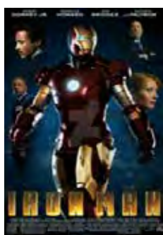
Iron Man: El Hombre De Hierro (Iron Man) [2008] Dir: Jon Favreau