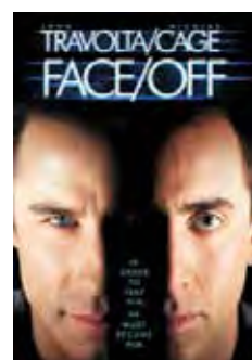
Contracara (Face / Off) [1997] Dir: John Woo