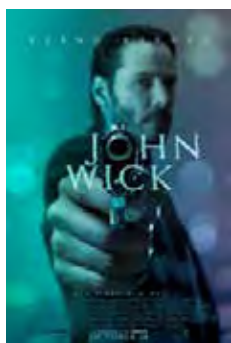
John Wick: Sin Control (John Wick) [2014] Dir: Chad Stahelsky, David Leitch