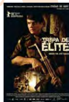
Tropa De Elite (Tropa de Elite) [2007] Dir: José Padilha