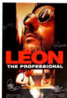
El Perfecto Asesino (Léon) [1994] Dir: Luc Besson