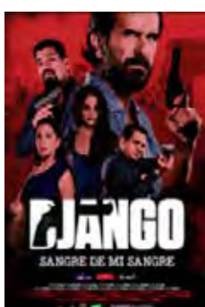
Django: Sangre De Mi Sangre (Django: Sangre De Mi Sangre) [2018] Dir: Aldo Salvini