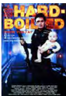
Hard Boiled (Lat Sau San Taam) [1992] Dir: John Woo