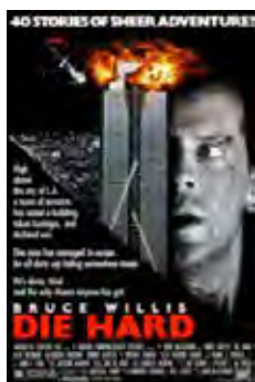
Duro De Matar (Die Hard) [1988] Dir: John McTiernan