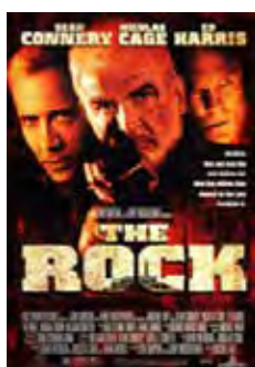
La Roca (The Rock) [1996] Dir: Michael Bay