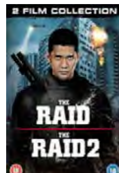
The Raid 1 y 2 (Serbuan Maut) [2011-2014] Dir: Gareth Evans