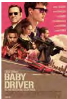
Baby: El Aprendiz Del Crimen (Baby Driver) [2017] Dir: Edgar Wright