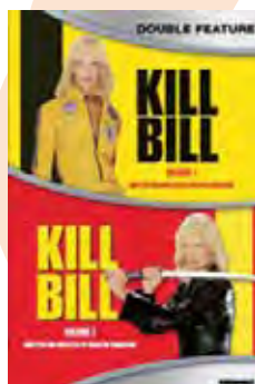
Kill Bill: Vol. 1 y 2 (Kill Bill) [2003-2004] Dir: Quentin Tarantino