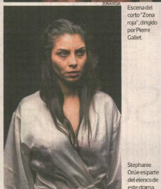
Escena del corto "Zona roja", dirigido por Pierre Gallet.