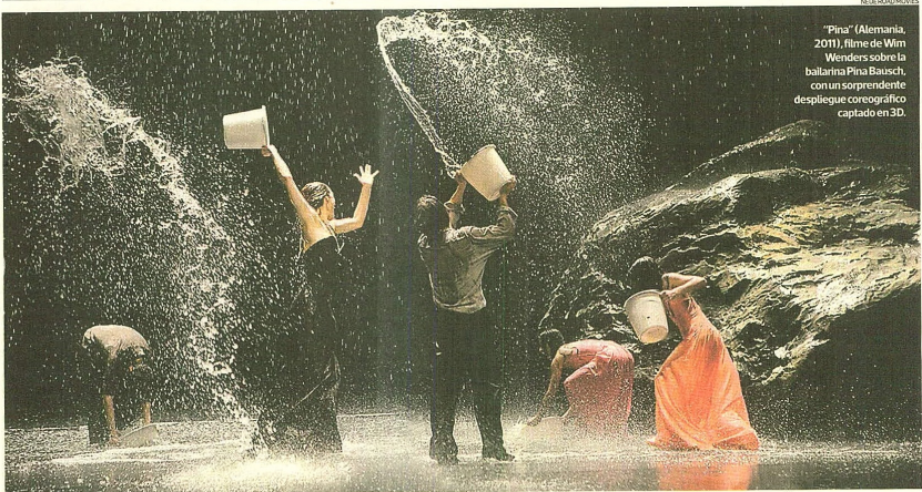
"Pina" (Alemania, 2011), filme de Wim Wenders sobre la bailarina Pina Bausch, con un sorprendente despliegue coreográfico captado en 3D.