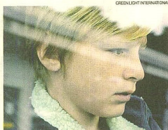
La muestra abre con "Custodia", filme con el que el francés Xavier Legrand se impuso en el último Festival de Venecia.