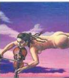
FIGURA HUMANA Y EL ENTORNO

Artistas de la Escuela Nacional Superior Autónoma de Bellas Artes expondrán sus obras en la muestra Vóragine (del cuerpo al vacío) . Lugar: Casa Rubens (Benigno Comejo 447, Pueblo Libre). Horario: Se inaugura hoy, a las 7 p.m.