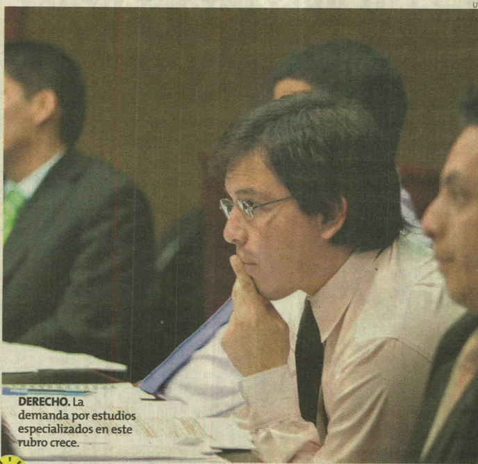
DERECHO. La demanda por estudios especializados en este rubro crece.

Alegría señaló, sin embargo, que la oferta se está diversificando. Actualmente tienen mucha acogida los posgrados en Gobierno y Políticas Públicas, que incluyen entre sus alumnos a coroneles de la Policía y personal de los ministerios y otros sectores. El tercer grupo con mucha demanda es el Derecho Comercial, en sus