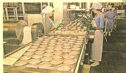
Compras. Comercializadoras también comprarán atún.

riano, aunque es capturado en mar peruano, por lo que no tiene los beneficios para ser exportado a los mercados con TLC. “Por eso se está trabajando de manera coordinada con Víctor Shiguayama (de Sunat) para establecer una renta presunta que podría ser del 5%, 6% o 7%. Evitaremos que el atún sea importado, siendo peruano, para darle la oportunidad para que el atún sea enlatado y exportarlo a mercados, que pueden ser una enorme cantidad. Entonces habrá impacto también favorable en las exportaciones”, señaló.