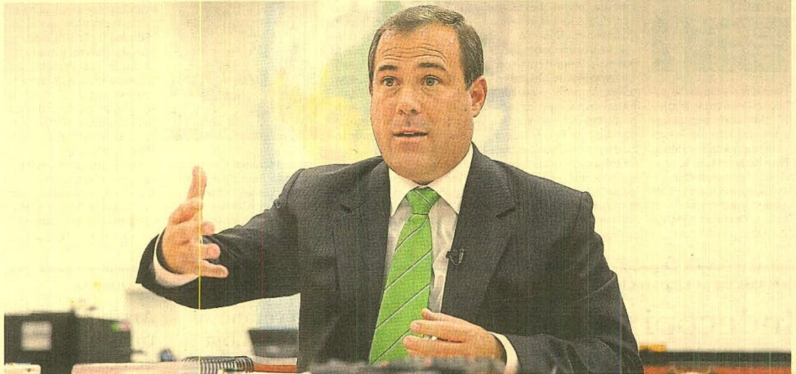
Destrabe. Dimetutriba ha permitido identificar 1,124 trabas empresariales registradas, no para el ciudadano que es un mundo aparte.

Estamos supercontentos en lo que hemos avanzado, Dimetutriba nos ha permitido identificar 1,124 trabas empresariales registradas, no para el ciudadano, que es un mundo aparte. Con las normas que hemos sacado el 13% de esas trabas ya están resueltas, y con las