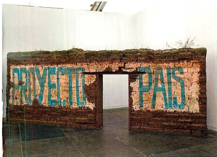
Obra de Ximena Garrido Lecca en libro del MATE sobre arte contemporáneo.

de los publicados en Chile, éste se ha preocupado de analizar detalladamente la producción artística del milenio sin hacer odiosas omisiones ni venias al mercado, y menos a las consabidas relaciones personales.