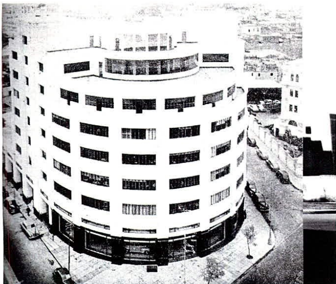
Edificio Ferrand. El proyecto incluye planos, fotos, una página web y una app.