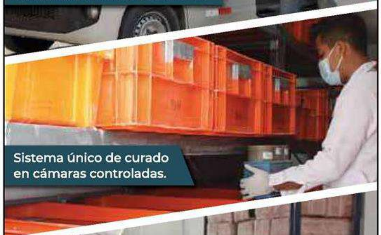
Sistema único de curado en cámaras controladas.