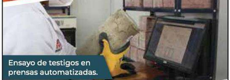
Ensayo de testigos en prensas automatizadas.