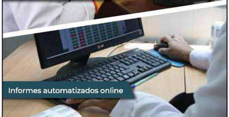
Informes automatizados online