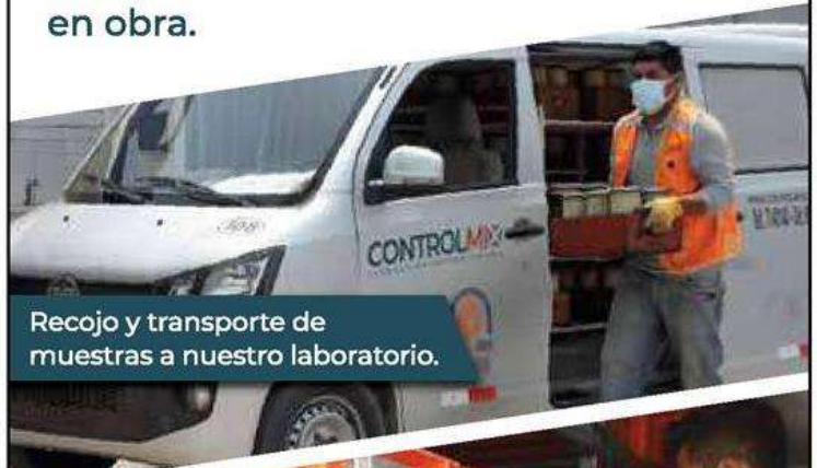
Recojo y transporte de muestras a nuestro laboratorio.

Innovación en el control de calidad del concreto en obra.