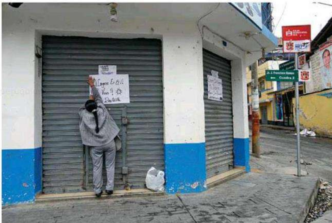
LAS PROTESTAS OBLIGARON AL CIERRE DE NEGOCIOS EN ANDAHUAYLAS Y OTRAS CIUDADES. AL CIERRE DE EDICIÓN, HABÍA 7 MANIFESTANTES FALLECIDOS Y 200 POLICÍAS HERIDOS.