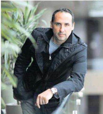
Schuldt es uno de los directores peruanos más prolíficos en el campo de la animación. Estrenó "Piratas en el Callao" en el 2005.

El director de "Piratas en el Callao", "El Delfín" y "Condorito: la película" conversó con El Comercio a propósito del estreno de "Una aventura gigante", el 12 de enero del 2023.