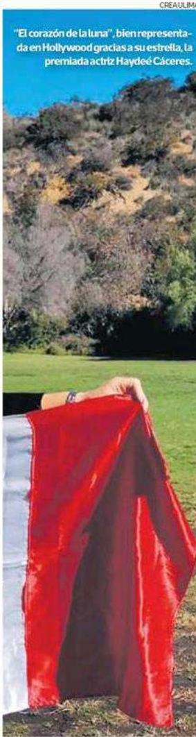
"El corazón de la luna", bien representada en Hollywood gracias a su estrella, la premiada actriz Haydé Cáceres.

próxima oportunidad, si es que se da. Vamos a tener mucho más claro qué tenemos que hacer, porque es un montón de trabajo", puntualizó Coello.