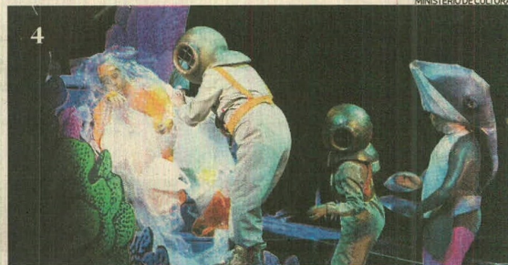
MINISTERIO DE CULTURA