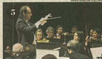
MINISTERIO DE CULTURA