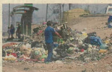
El manejo de residuos aún está pendiente.