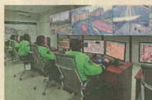
Plantean optimizar sistemas de videovigilancia.