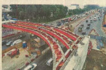
El Derby es una de las obras aún inconclusas.