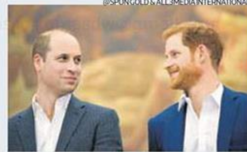
@SPUNGOLD & ALL3MEDIA INTERNATIONAL