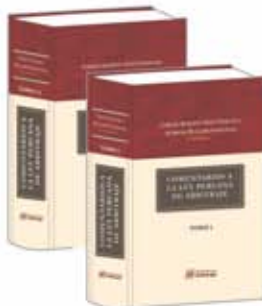
"COMENTARIOS A LA LEY PERUANA DE ARBITRAJE" Tomo I y II