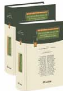
"CONVENCIÓN DE NUEVA YORK DE 1958"