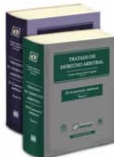
TRATADO DE DERECHO ARBITRAL "El Convenio Arbitral" Tomo I y II