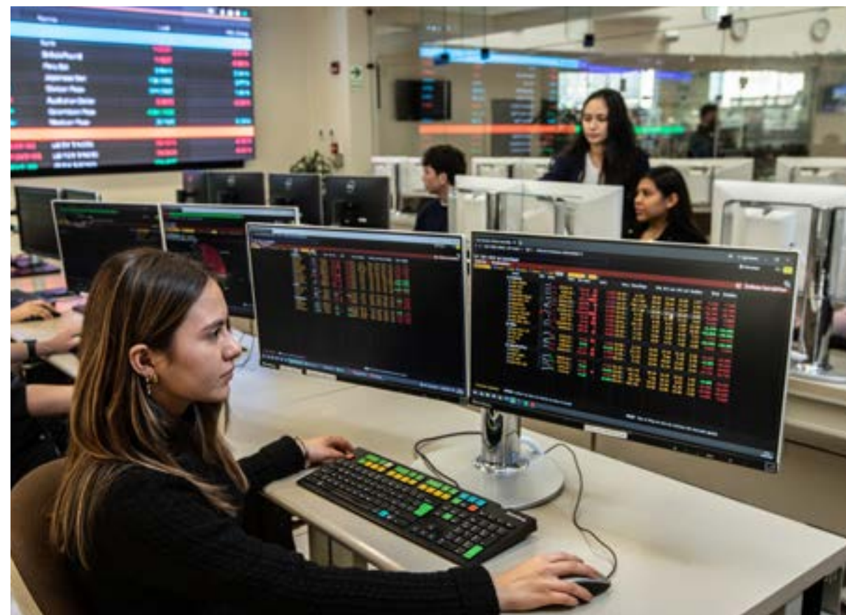
Laboratorio de Mercado de Capitales