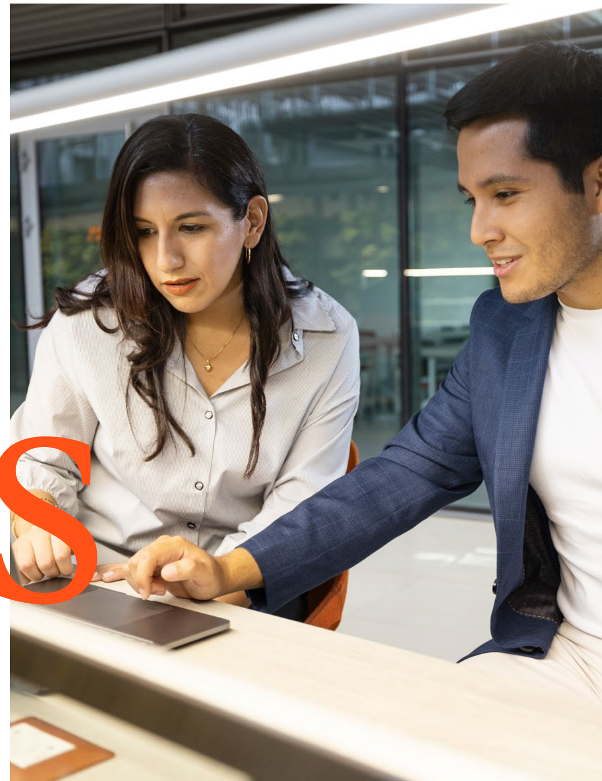
Espacios de estudios

Desde aulas equipadas con la última tecnología hasta espacios diseñados para fomentar tu desarrollo físico, mental y cultural, nuestro campus ofrece un ambiente inspirador que promueve el aprendizaje y el crecimiento personal.