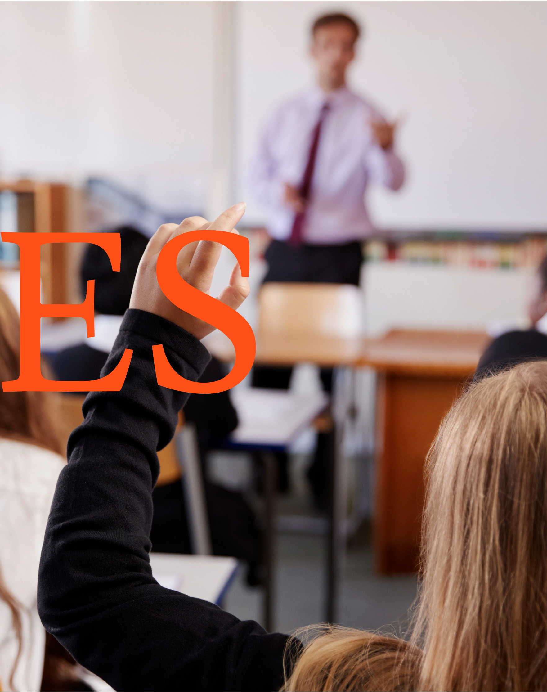
Nota 1: La plana docente podrá variar de acuerdo con los requerimientos de la Escuela de Posgrado.

Magíster en Arquitectura y Sostenibilidad por la Universidad Ricardo Palma. Gerente general de Desarrollo de la Corporación Suyo Urbanistas.