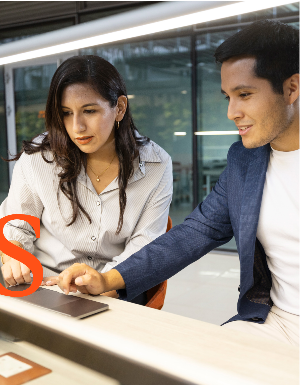
Espacios de estudios

Desde aulas equipadas con la última tecnología hasta espacios diseñados para fomentar tu desarrollo físico, mental y cultural, nuestro campus ofrece un ambiente inspirador que promueve el aprendizaje y el crecimiento personal.