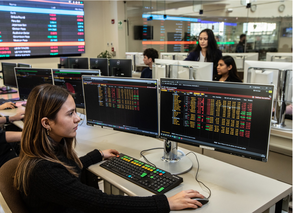
Laboratorio de Mercado de Capitales