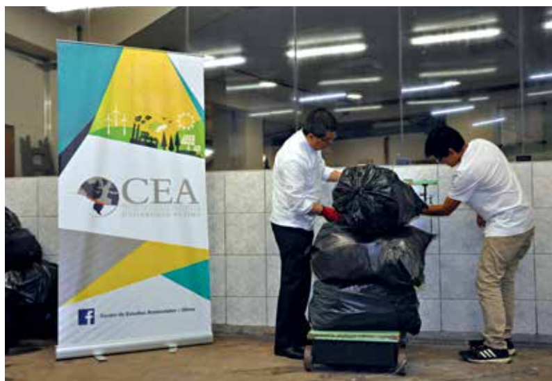
Los alumnos de la Escuela Universitaria de Ingeniería participaron con gran entusiasmo en la Reciclación 2015.