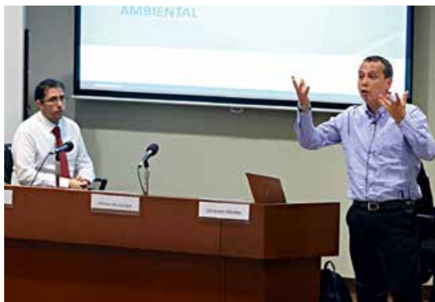
La economía verde facilita un debate con fundamento técnico y objetivo entre los actores de los conflictos socioambientales.

Los expositores también mencionaron la economía ambiental, que definieron como una corriente que se basa en la economía clásica y que se alinea con la promoción de las actividades extractivas, aunque considerando las externalidades negativas (el daño que la actividad económica genera a terceros); algo que podría ayudar al Estado a resolver los conflictos socioambientales. Ambos indicaron que introducir el enfoque de la economía ambiental en la política pública serviría para que el debate no se preocupe tanto en si el proyecto minero va o no va, sino más bien en si los montos estimados de compensación por los daños son los justos o si la estimación de las probabilidades de contaminación es asertiva o no. ■