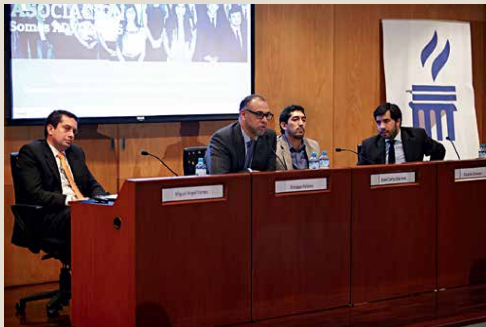
Especialistas comentaron diversas formas de aplicar la responsabilidad social en el derecho.

Socios de diversos estudios de abogados y especialistas atendieron la convocatoria de la Carrera de Derecho de la Ulima para analizar la importancia de la responsabilidad social en el derecho y la actualidad tributaria.