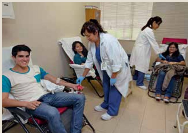
La comunidad Ulima participa con entusiasmo en cada campaña de donación de sangre.

junio se desarrolló, todos los jueves, viernes y sábados, la Campaña de Vacunación - Invierno 2015, en la que se aplicaron más de 400 vacunas para la influenza, neumonía, hepatitis B, hepatitis A y papiloma en el Departamento Médico de la Universidad de Lima, ubicado en el primer piso del Edificio F.