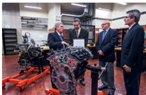
Autoridades Ulima estuvieron presentes en la entrega de esta donación.

punto en el que se requiere, más que nunca, un trabajo conjunto y coordinado entre el gobierno, la universidad y la empresa. En ese sentido, esta importante donación es una muestra de esa cooperación que el país necesita”, afirmó nuestro vicerrector.