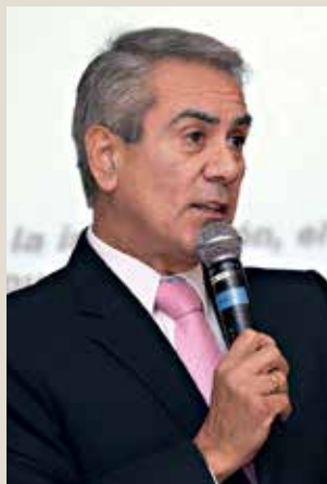
Jorge Sarmiento Díaz, vocal del Tribunal Fiscal.