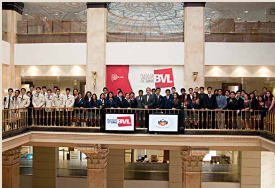
Los alumnos que participaron en el XIV Seminario y Juego de Bolsa para Colegios dieron el tradicional campanazo de apertura en la Bolsa de Valores de Lima.