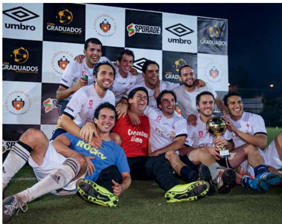
Equipo campeón de la Copa de Graduados 2015-1.

La actividad se llevó a cabo en la piscina semiolímpica del Campus Villa de la Universidad Peruana de Ciencias Aplicadas, el 16 y el 17 de mayo, y contó con la participación de 312 deportistas de 16 institucio-