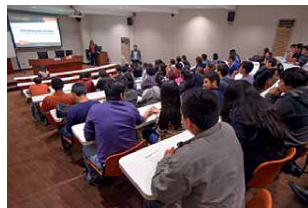
Los alumnos Ulima recibieron información precisa de los cazatalentos para mejorar sus habilidades laborales.

Además, en la explanada del Edificio F, Laborum instaló un módulo y brindó asesorías sobre cómo mejorar un currículum vitae. ■