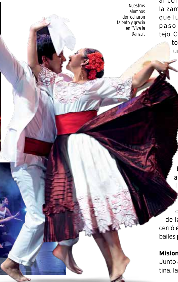
Nuestros alumnos derrocharon talento y gracia en "Viva la Danza".

Una fiesta de danzas peruanas se vivió el 18 de junio en el Auditorio ZUM de la Universidad de Lima. Todo el recinto se llenó de la energía de los danzantes, que pasaban del elegante coqueteo de la marinera al ritmo sensual y alegre del festejo, y luego a esa lucha entre el bien y el mal que nos muestra la diablada, entre otros bailes que encantaron a los espectadores en el espectáculo "Viva la Danza". Esta celebración, organizada por el Departamento de Talleres Artísticos de la Universidad de Lima, fue el resultado del arduo trabajo que llevan a cabo estos alumnos, dedi-