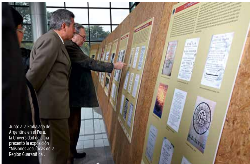
Junto a la Embajada de Argentina en el Perú, la Universidad de Lima presentó la exposición "Misiones Jesuíticas de la Región Guaranítica".