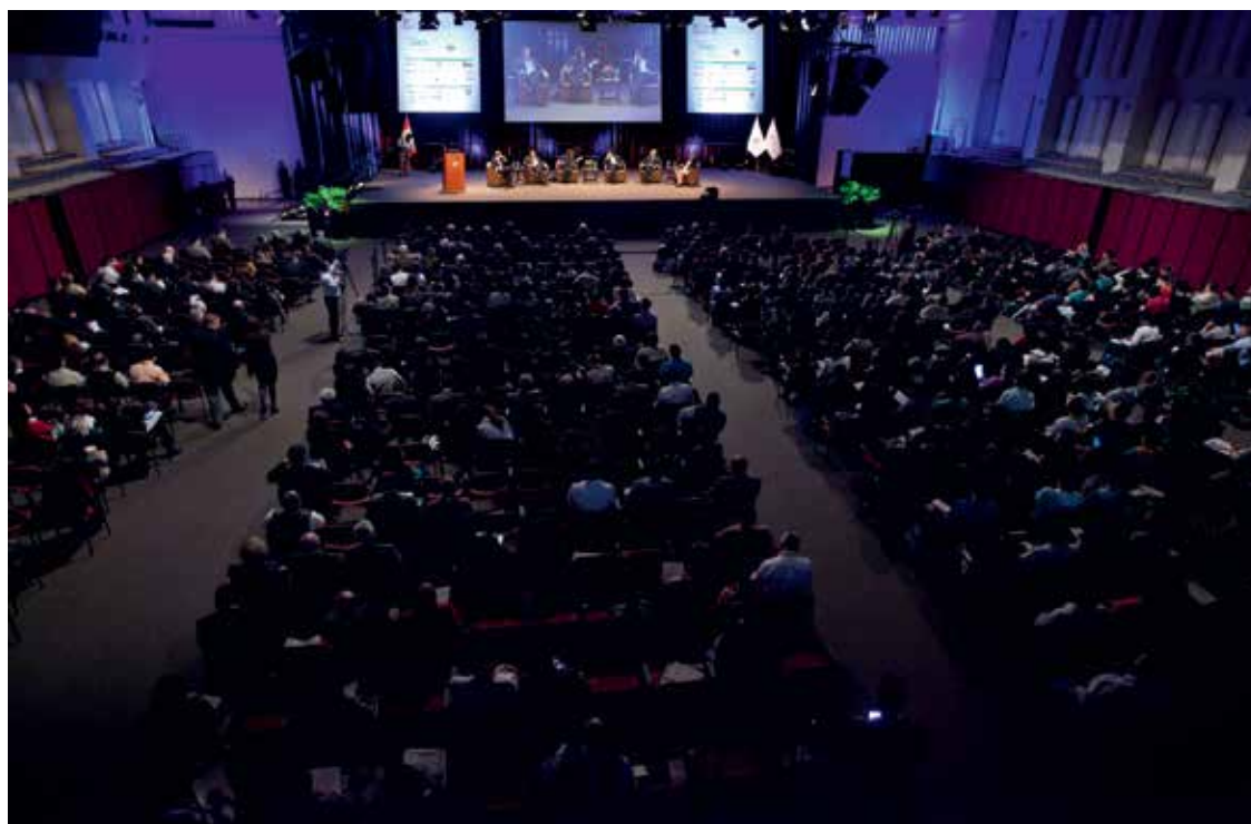
Empresarios y académicos revisaron opciones de diversificación productiva en el Perú.