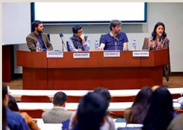
Arquitectos españoles compartieron sus experiencias con los alumnos Ulima.

Entre las ventajas, mencionó que ofrece un mejor control de grietas, estructuración libre de columnas y reducción de la masa total, pues el espesor de las losas postensadas es 30% menor al de las convencionales, reduciendo entre 20% y 30% el peso total del edificio. Entre las desventajas, el cálculo resulta más complejo y requiere más detalle, así como mano de obra y técnicos especializados. ■