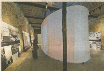
Una muestra de lo que será el pabellón mexicano en el evento en Venecia.