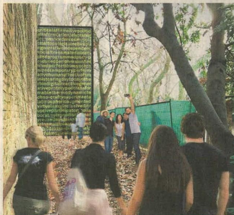
España, ganadora del León de Oro en el 2016, apunta a repetir el logro.