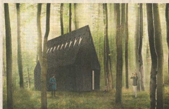
El Vaticano participará por primera vez en la Bienal de Arquitectura.

En suma, un conjunto de proyectos que engloban una enriquecedora diversidad de miradas.