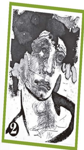
1) Litografía de Joan Miró, parte de La melodía ácida. 2) Grabado de Salvador Dalí que ilustra La vida es sueño, de Calderón de la Barca.

Piezas de ambos maestros se exponen desde hoy en el Centro Cultural de la Universidad de Lima. El ingreso es libre.